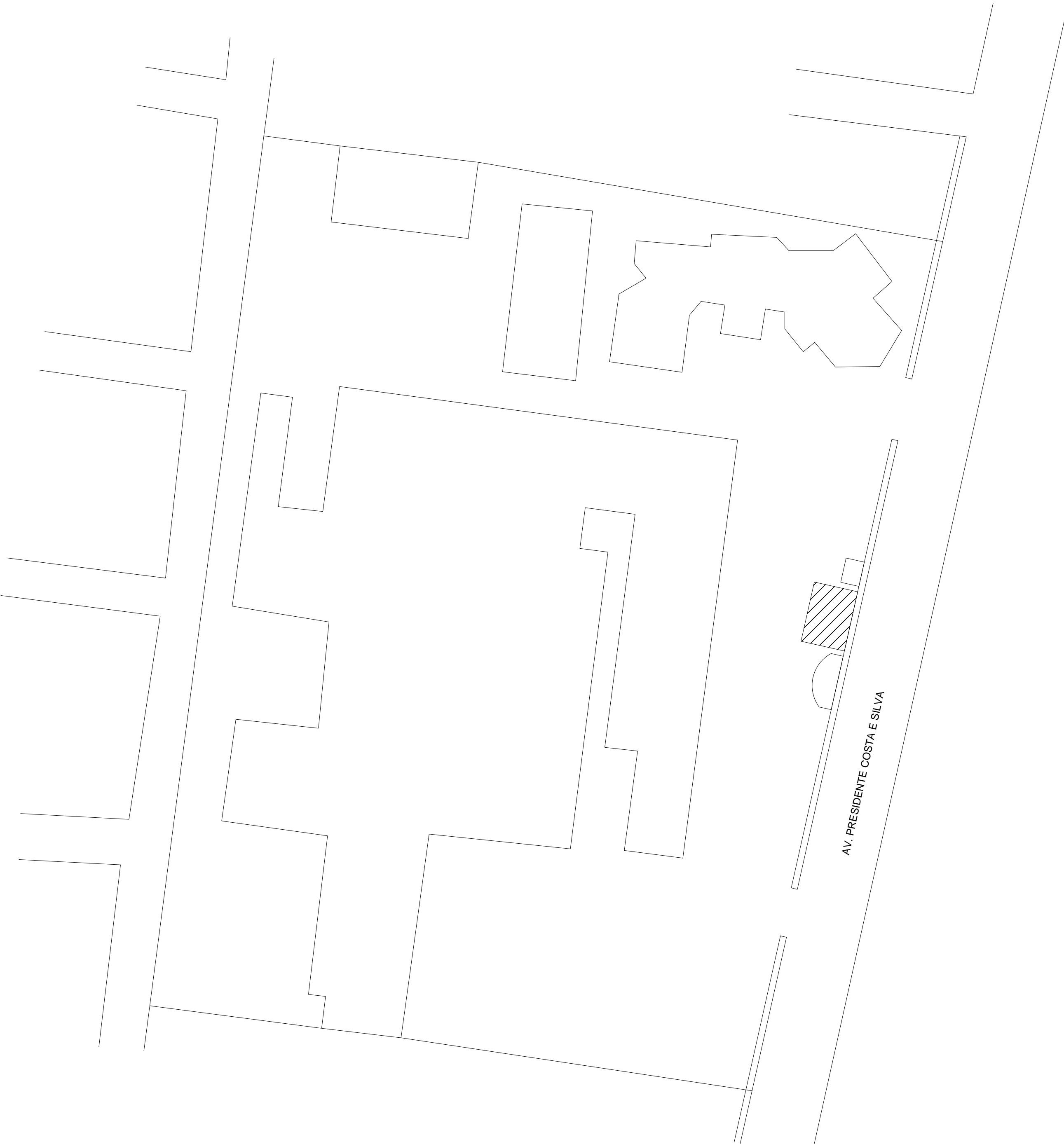
PLANTA DE SITUAÇÃO GERAL DO HOSPITAL ESC.: 1/100